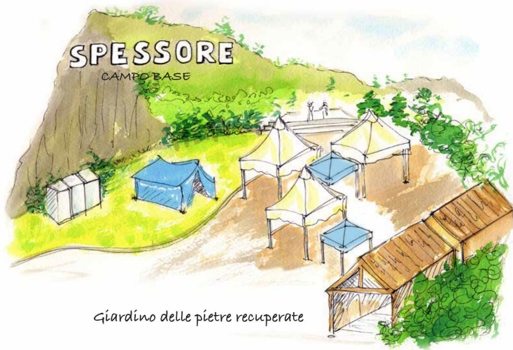
Giardino delle pietre recuperate